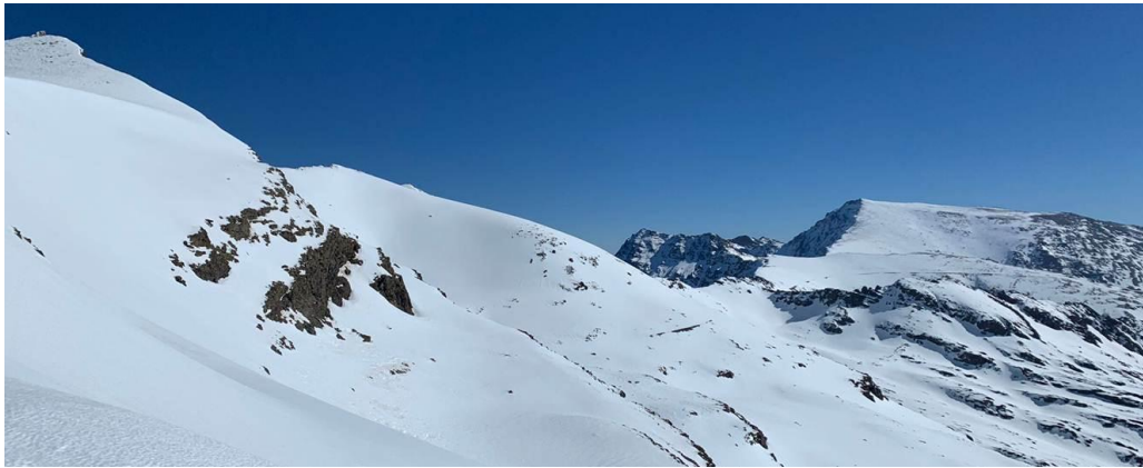
Del Veleta al Mulhacén desde el collado de la Carihuela 23-2-21