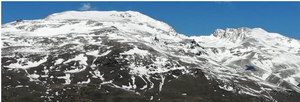
Cara sur Mulhacén y circo de 7 Lagunas 24-2-21