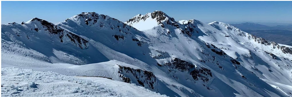
Tajos de La Virgen y Cartujo 23-2-21